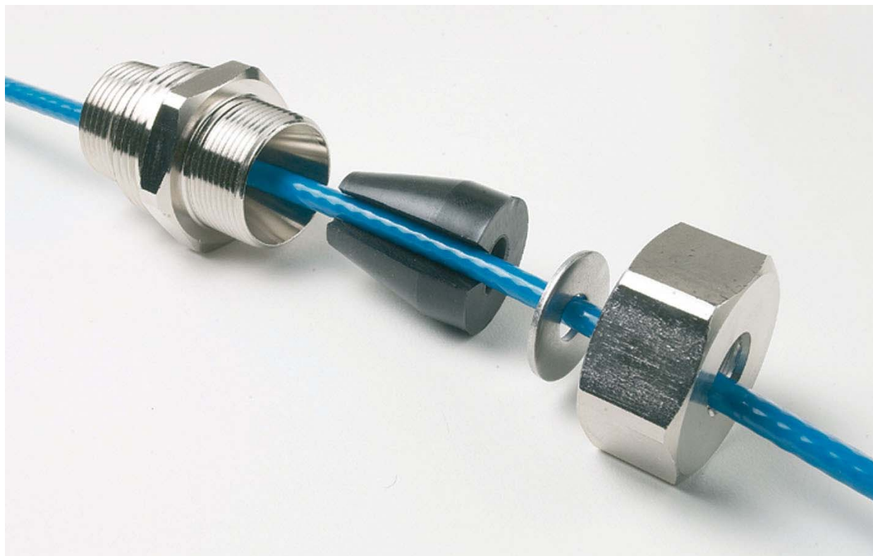
Рис.2. Устройство муфты зажимной для ввода кабеля DPH-10 в трубопровод: корпус, уплотнительная манжета, шайба, накидная гайка (слева направо).

Муфта зажимная состоит из 4-х частей (рис.2):