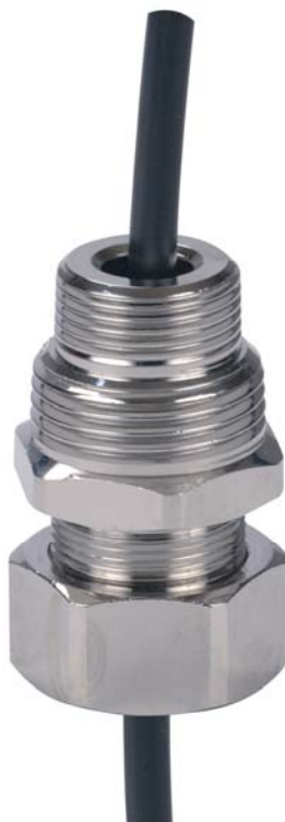
Рис.1. Муфта зажимная в сборе.

Муфта имеет один вариант исполнения, однако имеет на подсоединительной втулке двухступенчатую резьбу, благодаря чему может применяться в трубопроводах диаметром \frac{3}{4} " и 1" (рис.1).